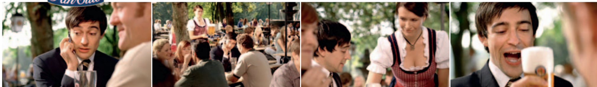
Im neuen TV-Spot sagt der britische Paulanergarten-Gast erst pausenlos „Yes“ am Handy – und dann zum Paulaner Hefe-Weißbier.