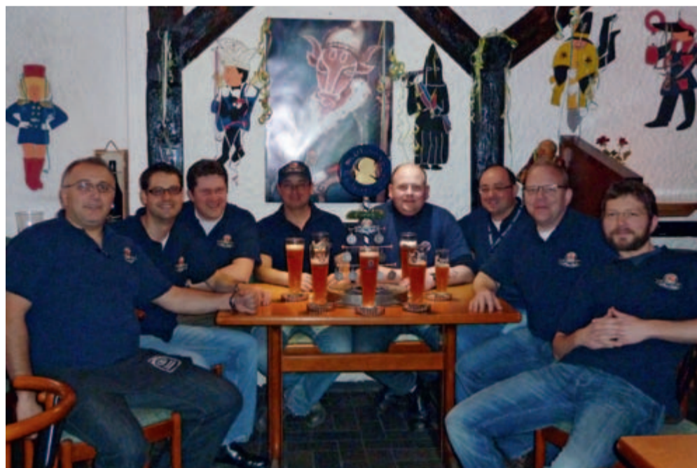
Die Paulaner Fan Club-Mitglieder an ihrem Stammtisch im Ellwanger „Altstadt-Bistro“.

Einmal im Jahr will die kleine Runde in ganz großem Rahmen feiern: Seit 13 Jahren veranstaltet der Paulaner Stammtisch jeweils am