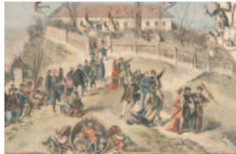
Die Postkarte zeigt: Schon um 1900 zogen die Münchner in Scharen auf den Nockherberg.

Ein Ritual, das bis heute jedes Jahr beim Salvator-Anstich auf dem Nockherberg bewahrt wird, wenn der bayerische Ministerpräsident den ersten Schluck bekommt. Ebenso unverändert blieb auch die Grundrezeptur von Bruder Barnabas – nicht zuletzt deshalb gilt der Salvator als „Stammvater“ aller Starkbiere.